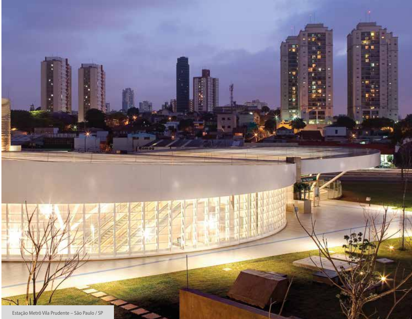
Estação Metrô Vila Prudente – São Paulo / SP